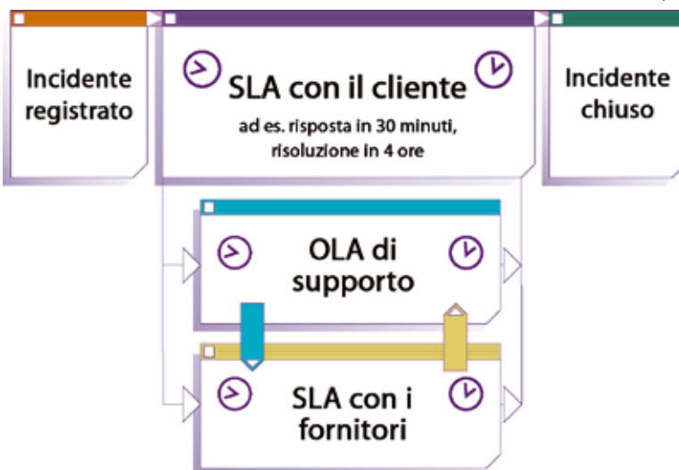
Struttura tripla di SLA esclusiva di assyst